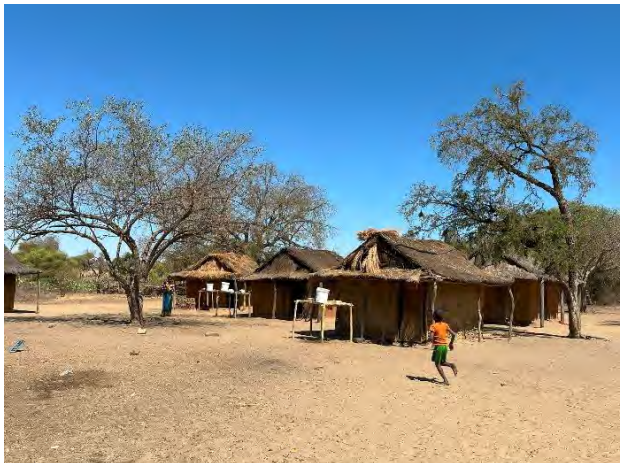
Bevoay Ambalabe: Hütten mit Wassereimern

In Ambatry wurde 2008 mit Mitteln von GAH ein „traditioneller“ Brunnen erstellt. 2012 wurde er vertieft, mit einer Solarpumpe ausgestattet und durch ein Reservoir sowie verschiedene Entnahmestellen ergänzt. Die damit verbundenen Begleitmassnahmen sind noch nicht konsequent vollzogen. Taratra wird deshalb mit den Bewohnerinnen und Bewohnern eine Standortbestimmung vornehmen und die weiteren Schritte klären.