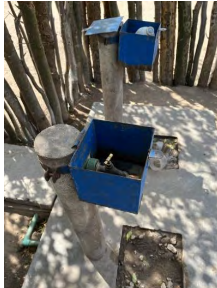
Ananavy: Abschliessbarer Zapfhahn