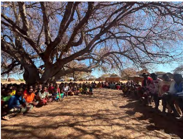
Beroy Ambalabe: Begrüssungsrunde

In beiden Dörfern werden uns auf engagierte Art im Rahmen der Dorfversammlung mittel- und längerfristige Vorstellungen zur Dorfentwicklung vorgestellt. Es freut uns sehr, dass es zunehmend gelingt die Menschen zu einem Blick in die Zukunft zu bewegen und somit selbst aktiv zu werden.