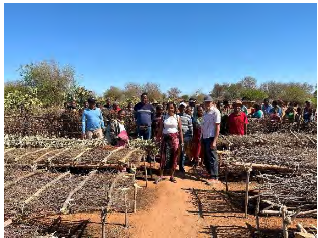
Bevoay Ambalabe: Garten mit beschatteten Beeten