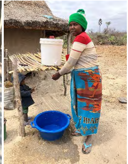
Ananavy: Händewaschen wird einfacher