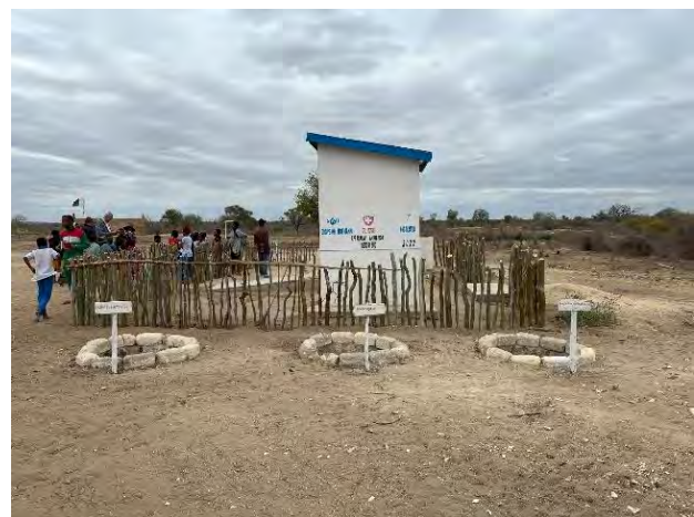
Ananavy: Latrinen und Abfalltrennung

Der Unterhalt des Brunnens inkl. regelmässiger Überprüfung der Wasserqualität wird durch einen „Gestionnaire“ sichergestellt. Die einzelnen Brunnen werden durch einen „Fontainier“ betreut; die Entnahme von Wasser ist für die Familien kostenpflichtig (500 Ariary oder etwa 10 Rappen pro Kanister à 20 lt). So wird