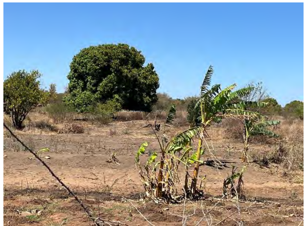
Ambatofotsy Est Bananenstauden und Mangobaum