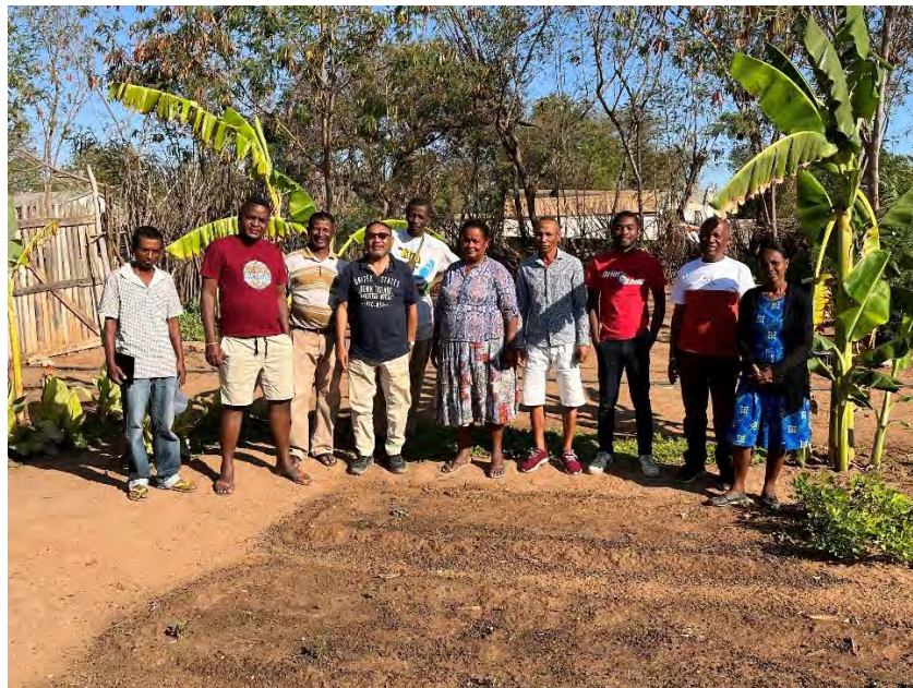
Das Team von Taratra Betioky

Fazit zum Schluss bei Taratra: es war eine aufschlussreiche Reise; wir dürfen zufrieden sein. Die nächsten Schritte sind festgelegt – wir bleiben dran!